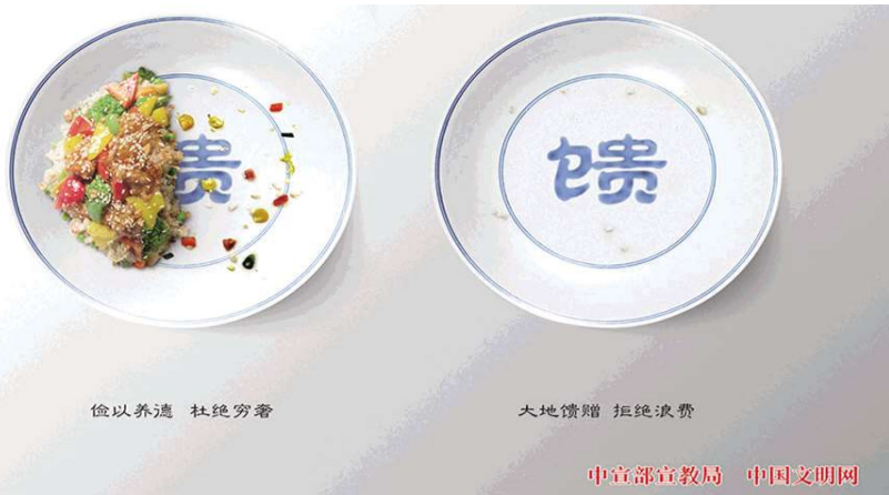
俭以养德 杜绝浪费