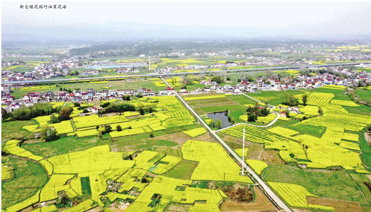
新仓镇花园圩油菜花海